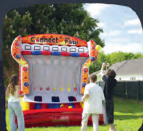
PUISSANCE 4 BASKET