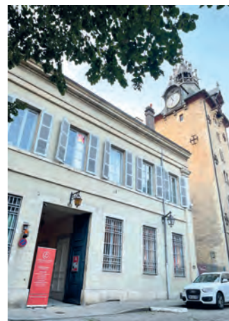
Maison de Ventes aux Enchères ALEXANDRE LANDRE ~ BEAUNE 26, place Monge à Beaune – beaune@alexandrelandre.com – Tél. 03 80 24 09 66 – www.alexandrelandre.com

Les trois ventes seront également retransmises sur les plateformes d'enchères Drouot et Interenchères . Que l'on soit collectionneur averti, amateur éclairé ou simple curieux, ces trois rendez-vous constituent une occasion unique d'acquérir des bouteilles rares, des objets de caractère ou encore des pièces d'exception, tout en réalisant de belles affaires dans une ambiance passionnante propre aux ventes aux enchères.