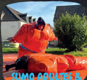
SUMO ADULTES & ENFANTS