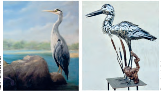
Œuvre : Pierre-Yves DAVID