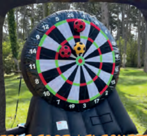
CIBLE FOOT / FLECHETTES