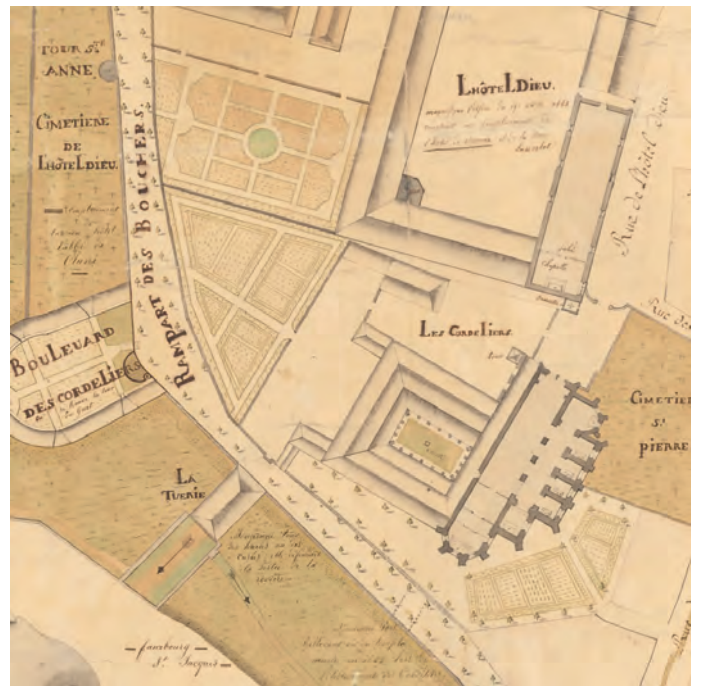
Plan Quinard : La Tuerie de Beaune sur le plan de la Ville de 1783.

La première enquête de la série, présente dans les archives, date de 1809. On sait ainsi qu'il y a à Beaune 56 mulets et 6 mules, 7 génisses, 12 béliers, 400 moutons (288 brebis, 200 agneaux). Ces bêtes pâturent « sur le plateau de la Côte et dans les terres en jachères » tandis que « le foin pour l'hiver est tiré des communes alentour ». Ces chiffres sont assez bas : le maire, Jean-Baptiste Edouard, ne déclare en effet ni chevaux ni porcs. Or il paraît peu probable qu'il n'y en eût pas à Beaune : l'enquête statistique a ici sans doute des limites qui nous échappent. En 1866, dans la ville de Beaune, on trouve encore 308 chevaux (hors ceux de l'Armée et de la Gendarmerie), 110 ânes ou mules, 266 vaches,