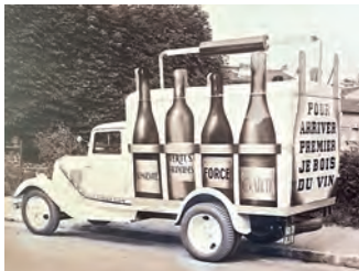
1938 : camionnette de propagande, caravane du Tour de France.

Château du Clos de Vougeot rue de la Montagne à Vougeot.