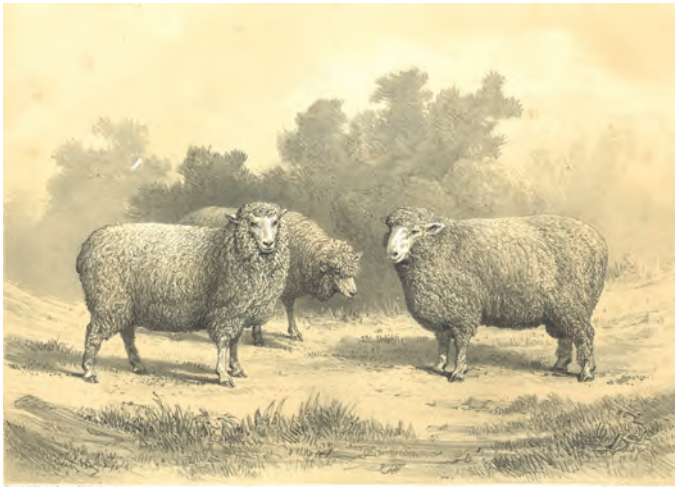
BÉLIER ET BREBIS DISHLEY MÉRINOS

L'art de compter les bêtes et les récoltes a accompagné l'émergence des grandes civilisations aux quatre coins du monde. En France, le XVIII e siècle a vu naître la rationalisation de la production agricole et la recherche de l'amélioration du bétail. Dans nos archives l'on constate qu'à partir de la Révolution, l'administration centrale maintient un contrôle étroit sur la situation des troupeaux et des bêtes domestiques présents en France. Les maires sont tenus de donner le nombre des chevaux, mulets, moutons, porcs et vaches au cours d'enquêtes qui se répètent à intervalle régulier. Outre le nombre des bestiaux, on interroge les communes sur la qualité des espèces produites, sur l'usage que l'on fait de ces animaux (bêtes de trait, à viande, à laine...), sur la santé des troupeaux... On constate que ces enquêtes intéressent aussi beaucoup l'armée : l'État est soucieux d'avoir, par exemple, de bons chevaux pour la cavalerie, mais aussi des moutons pour la viande et des bœufs pour le cuir et le suif.