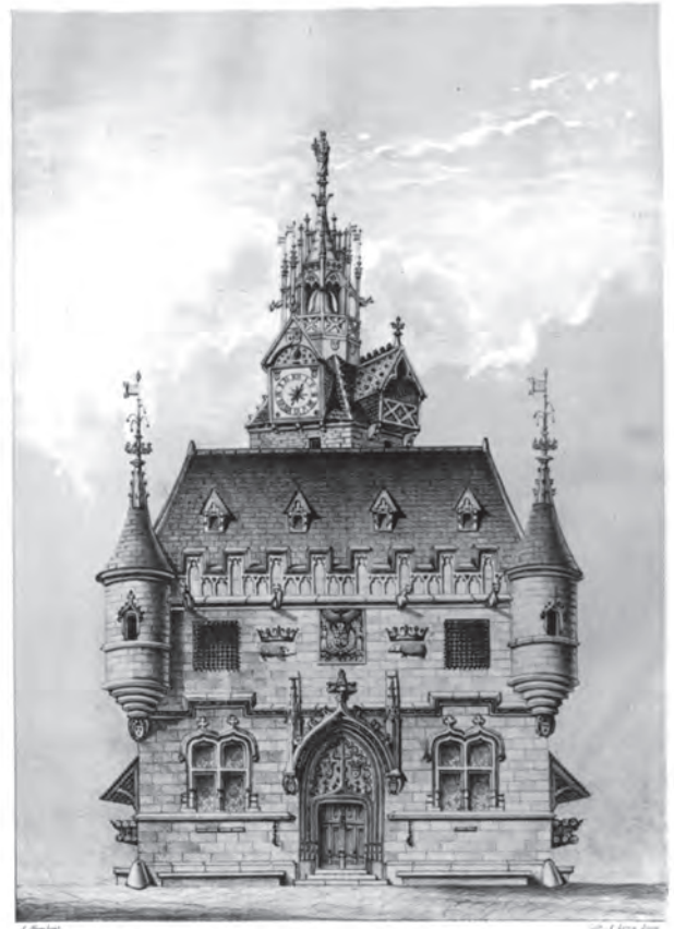
Hôtel de Ville : Ancien Hôtel de Ville de Beaune, sur l'actuelle place Monge, où se trouvait la prison avant la Révolution. 1 fi 44, AMB.

Ces cas ne sont pas isolés. Ainsi, tous les exemples relevés concernent des familles plutôt aisées de commerçants et d'artisans, de bourgeois, voire de petits nobles. La mise en prison par la famille de la femme garantit la disponibilité du prévenu dans les négociations qui sont vraisemblablement à l'œuvre entre les deux familles puisque chaque cas se termine par un mariage qui, selon les actes, est consenti par les deux époux. Cependant, une lecture trop littérale des textes peut cacher des cas tout à fait significatifs des mœurs d'Ancien Régime. Le mariage n'est que rarement affaire d'amour, même si ce n'est pas à exclure. On peut émettre plusieurs hypothèses sur les faits rencontrés : s'agit-il de relation entre amoureux qui trouvent une belle fin en mettant en scène le préjudice pour forcer le consentement des parents ? Y a-t-il derrière ces unions marchandées des