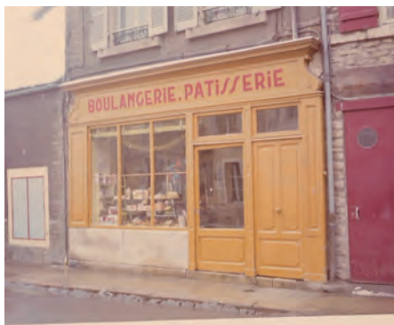
Photo Boulangerie Gavillon