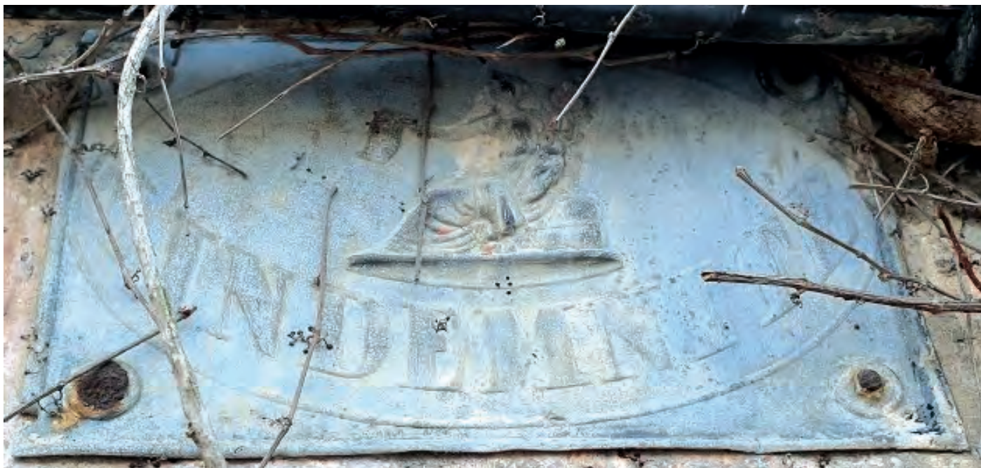
Plaque d'assurance compagnie l'Indemnité, Beaune, cliché de l'auteur.

Les Archives de Beaune sont ouvertes à tous du lundi au vendredi (fermé le mardi) de 9 h à 12 h 30 et de 13 h 30 à 17 h . Il est conseillé de réserver : 03 80 24 56 81 ou archives@mairie-beaune.fr Notre Blog : archivesbeaune.wordpress.com